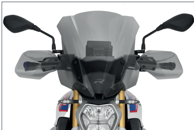
... oder rauchgrau - Artikelnummer: 30450-23x