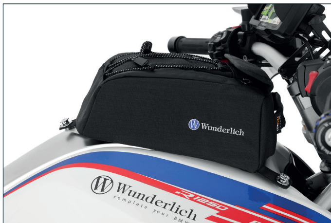
Wunderlich Tankrucksack »SPORT« - Artikelnummer 20653-400