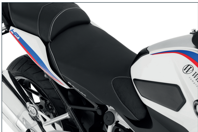
Wunderlich Fahrer-Sitzbank »AKTIVKOMFORT« Standardhöhe oder +30 mm - Artikelnummer: 30900-11x