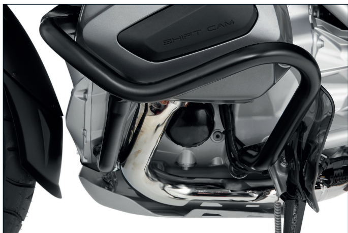
... in Schwarz ... Artikelnummer 26442-002