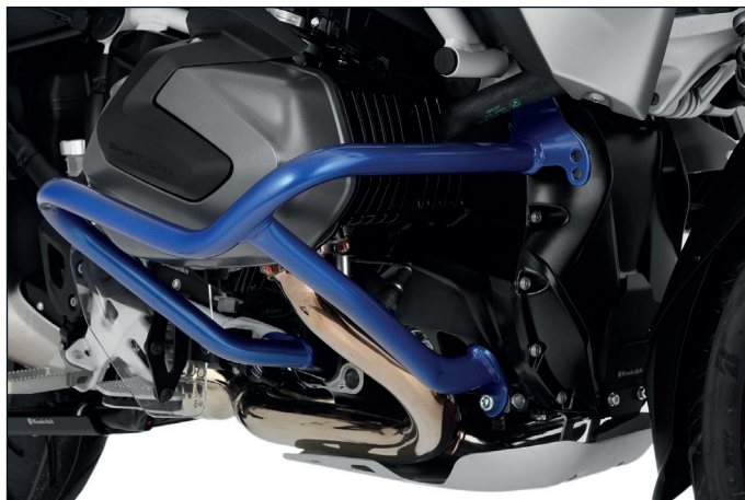
... in Blau ... Artikelnummer 26442-005