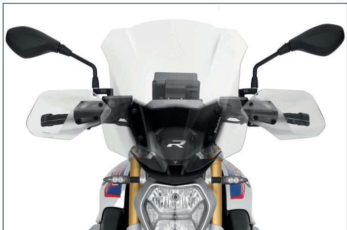
Wunderlich Verkleidungsscheibe »R-MARATHON« transparent ...