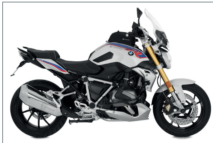
Perfekt roadstern: BMW R 1250 R mit Wunderlich-Komponenten

Die Fahrersitzbank »AKTIVKOMFORT« ist bereits ein Klassiker im Produktsortiment der Sinziger. Sie sorgt aufgrund des von Wunderlich entwickelten konturierten Schichtaufbaus des Polsters, in das eine Steißentlastung integriert ist, für die optimale Gewichtsverteilung. Sie zeichnet sich durch perfekten Komfort und unbedingte Langstreckentauglichkeit aus. Wunderlich bietet die Fahrer- und Beifahrer-Sitzbank in den Varianten „Standard“ mit der Originalsitzhöhe und die Fahrer-Sitzbank zusätzlich in einer „hohen“ Variante mit +30 mm Sitzhöhe an. Sie ist besonders für groß gewachsene Personen geeignet und sorgt zudem für einen entspannten Kniewinkel.