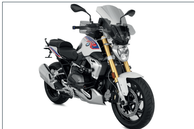
BMW R 1250 R mit Wunderlich-Komponenten