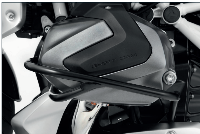
Wunderlich Motorschutzbügel »SPORT« ist in Schwarz und Weiß erhältlich - Artikelnummer 31740-30x