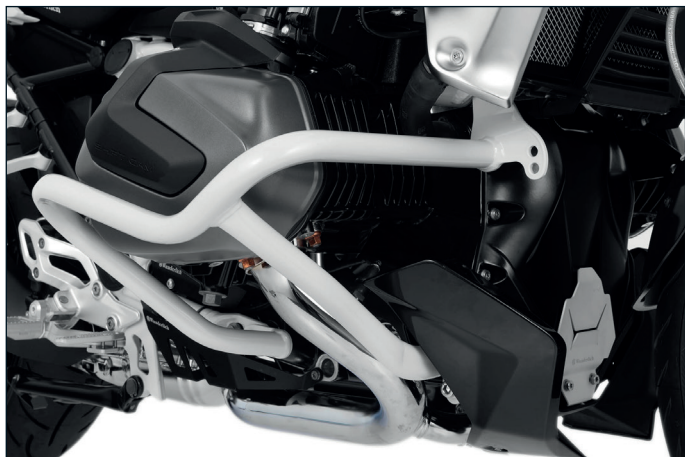
Wunderlich Motorschutzbügel R 1250 VA in Weiß ... Artikelnummer 26442-004