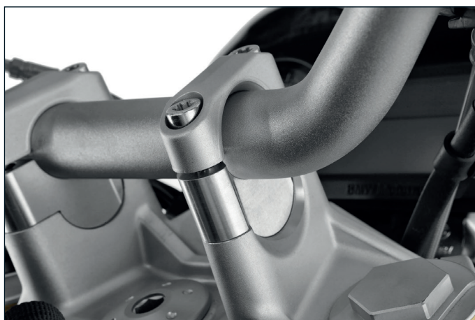
Wunderlich Lenkererhöhung +25 mm für Modelle mit und ohne Navi - Artikelnummern 31000-111 | -211