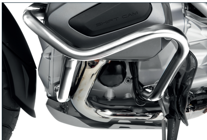
... und in VA, glasperlengestrahlt und elektroplattiert ... Artikelnummer 26442-000