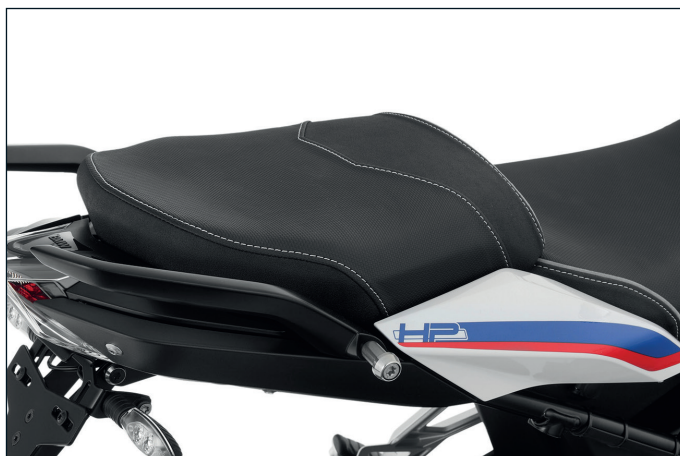
Wunderlich Beifahrer-Sitzbank »AKTIVKOMFORT« Artikelnummer: 30900-220