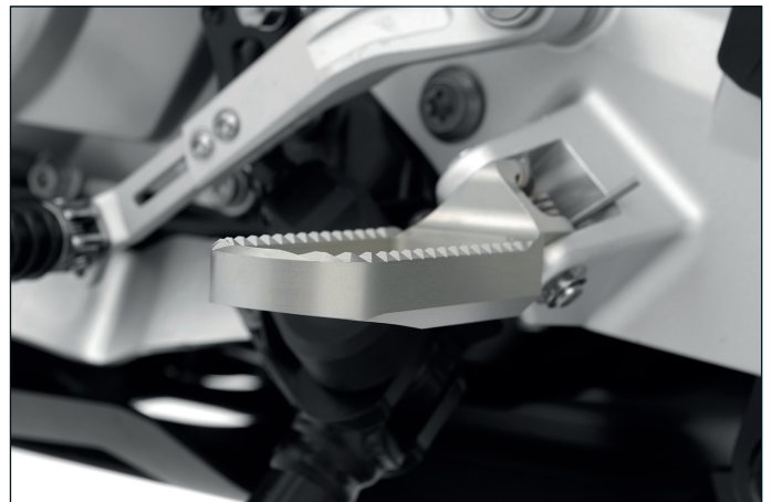
Wunderlich Tiefer Rastensatz ERGO-Comfort (Artikel-Nr.: 25910-201)