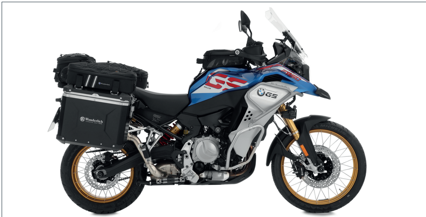
BMW F 850 GS Adventure mit Wunderlich-Ausstattung