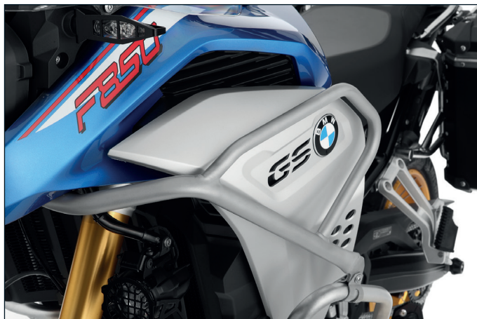
Wunderlich Tankschutzbügel »ADVENTURE« (Artikel-Nr.: 41580-400)