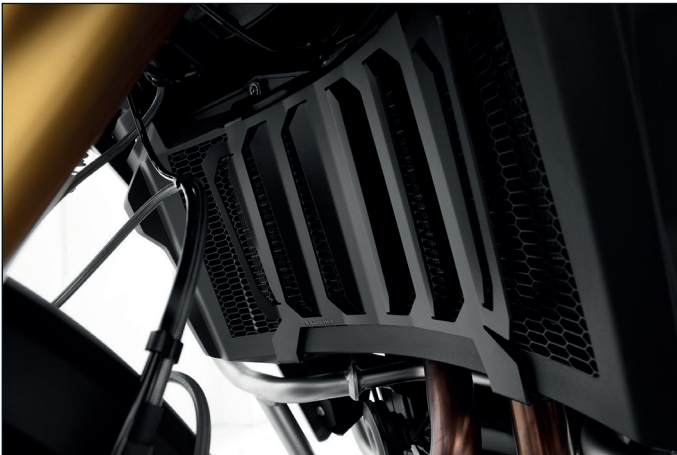
Wunderlich Wasserkühlerschutz »EXTREME« (Artikel-Nr.: 25854-002)