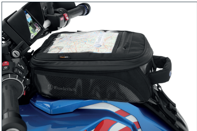
Wunderlich Tankrucksack ELEPHANT »TOUR Edition« (Artikel-Nr.: 40980-10x)