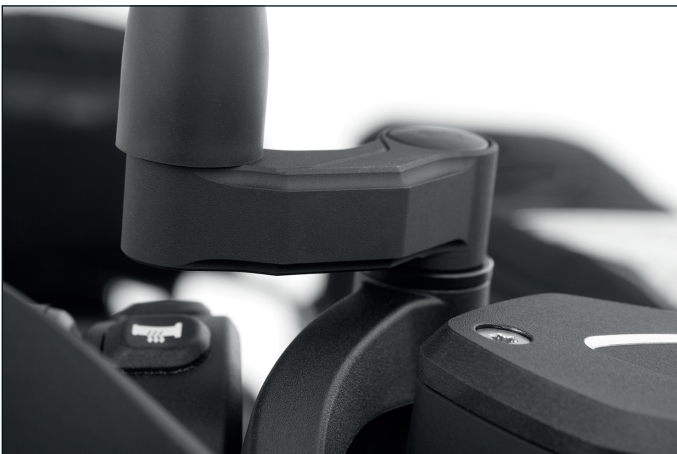
Wunderlich Spiegelverbreiterung (Artikel-Nr.: 26100-002)