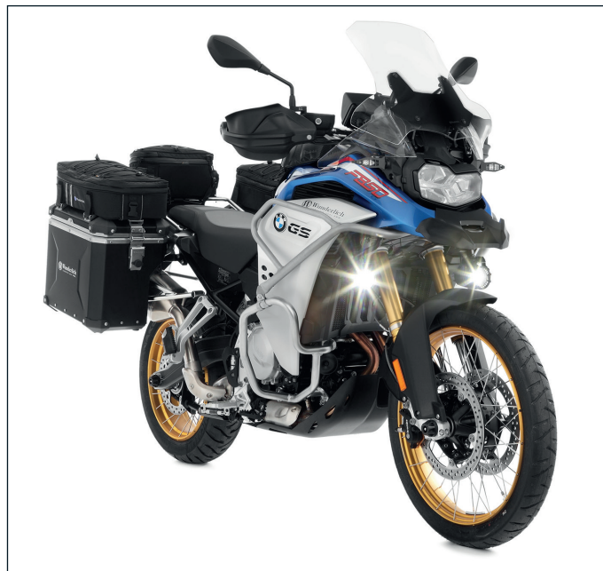
BMW F 850 GS Adventure mit Wunderlich-Ausstattung