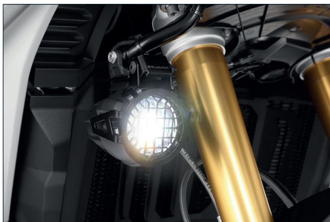
Wunderlich Lampenschutzgitter (Artikel-Nr.: 42839-302)