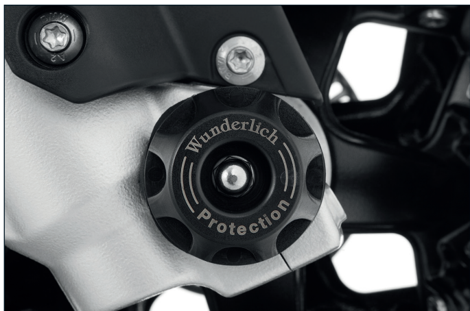
Wunderlich Achs-Schutzpads »DOUBLESHOCK« (Artikel-Nr.: 42156-102)