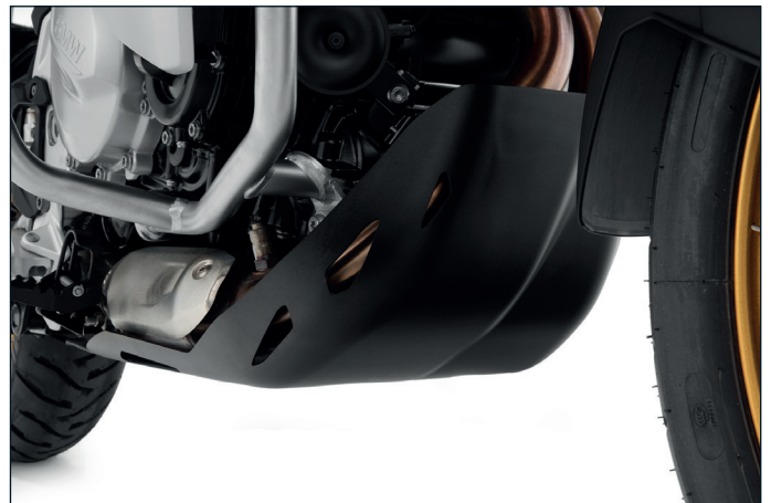
Wunderlich Motor- und Krümmerschutz »EXTREME+« (Artikel-Nr.: 26840-30x)