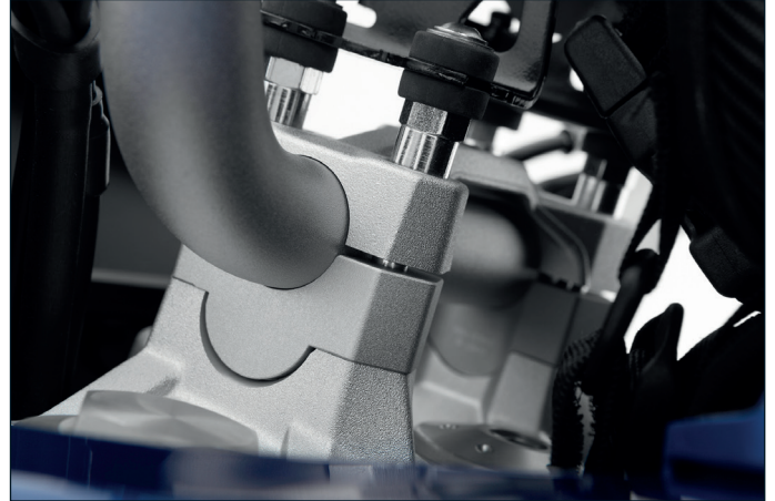
Wunderlich Lenkererhöhung »ERGO« (Artikel-Nr.: 25800-201)