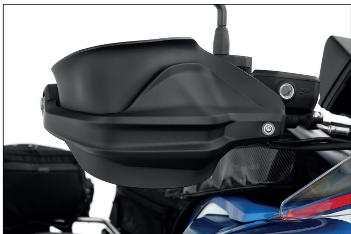
Wunderlich Handprotektorenverbreiterung »ERGO« (Artikel-Nr.: 44940-002)