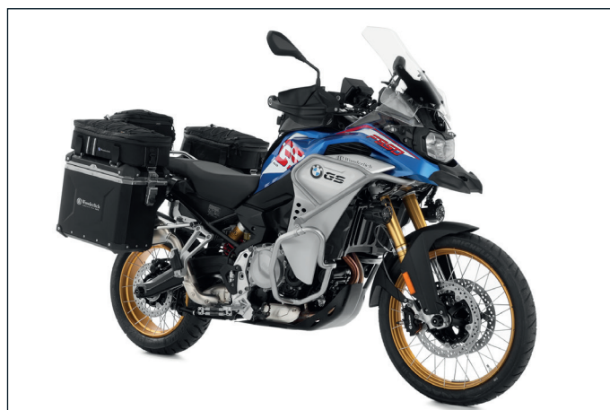
BMW F 850 GS Adventure mit Wunderlich-Ausstattung