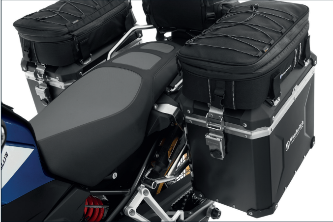
Wunderlich Gepäcksystem »EXTREME« (ohne Toptaschen) (Artikel-Nr.: 30167-30x)