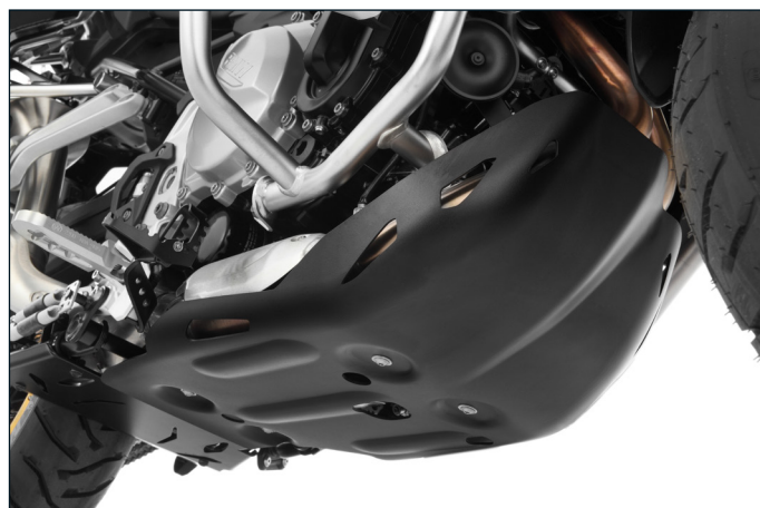
... oder schwarz eloxiert (Art.-Nr.: 26840-302)