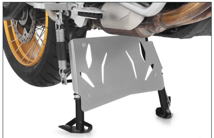
Wunderlich Hauptständerschutzplatte an der BMW F 850 GS und Adventure, silberfarben ... (Art.-Nr.: 25852-001)