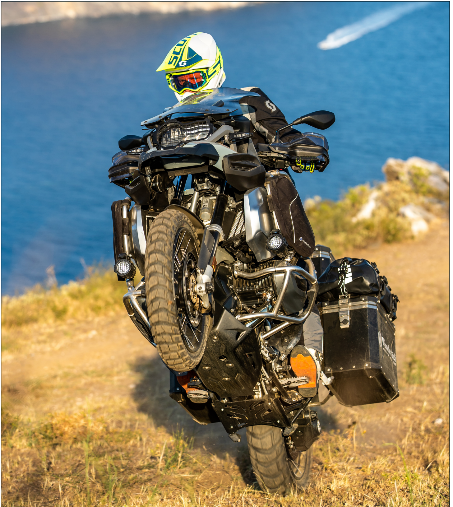
Erhältlich für weitere GS Modellreihen | Hier: Wunderlich Motorschutz und Hauptständerschutzplatte an der BMW R 1250 GS