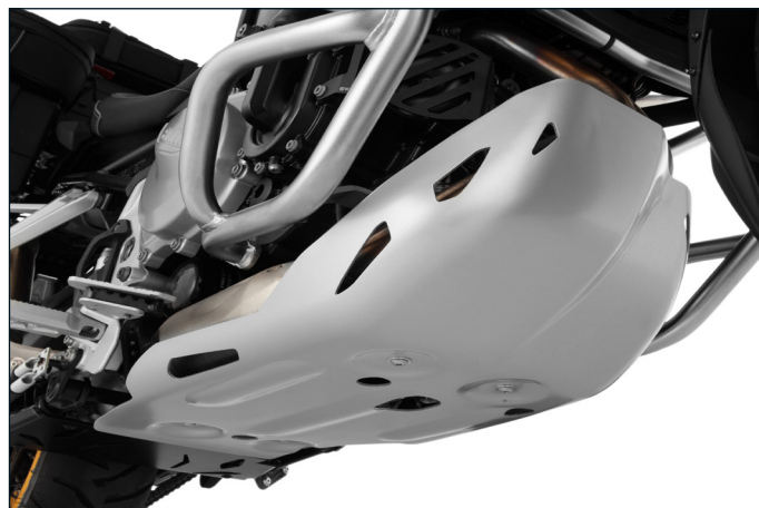
Wunderlich Motorschutz »EXTREME« an der BMW F 850 GS und Adventure, silberfarben ... (Art.-Nr.: 26840-301)

Die Hauptständerschutzplatte sorgt für den zuverlässigen Schutz des Hauptständers, des Auspuffsammlers und der Schwingenbasis. In Kombination mit dem passenden Motorschutz »EXTREME« werden alle Technikkomponenten zwischen Vorder- und Hinterrad zuverlässig gegen mechanische Belastungen wie Aufsetzen oder Steinschlag geschützt.