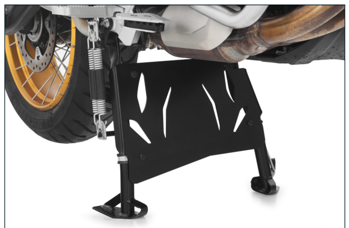
... oder schwarz eloxiert (Art.-Nr.: 25852-002)