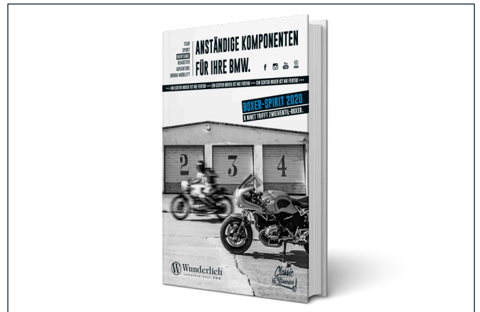
Unser neuer BOXER-SPIRIT Katalog für das Jahr 2020 - jetzt auf FSC® (Forest Stewardship Council) -zertifiziertem Papier gedruckt

Wunderlich legt das Katalogbuch in Deutsch und in Englisch auf. Der neue BOXER-SPIRIT wird ab der ersten Novemberhälfte ausgeliefert und kann ab sofort bei Wunderlich bestellt werden.