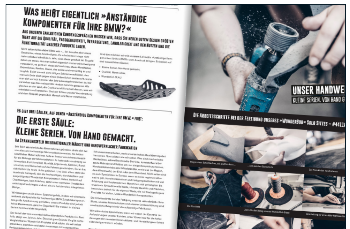
Ein kleiner Auszug aus unserem neuen Katalog über das WUNDERLICH Handwerk