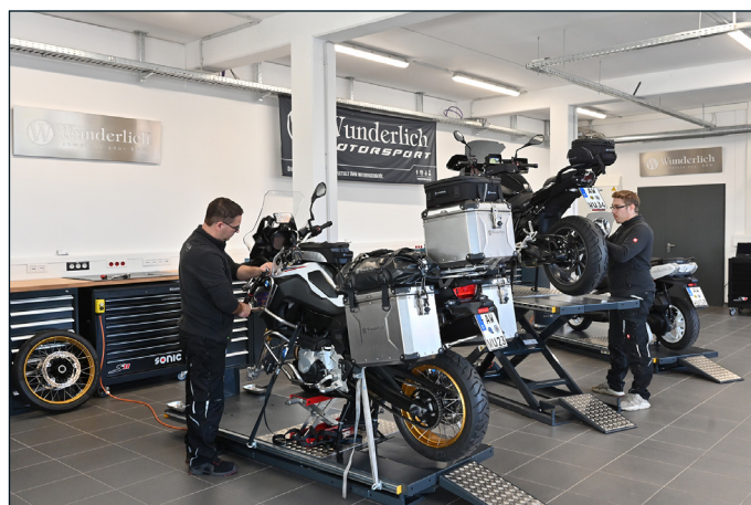
... dreht sich alles rund ums Fahrwerk.