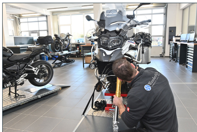
Im Wunderlich Suspension-Center ...