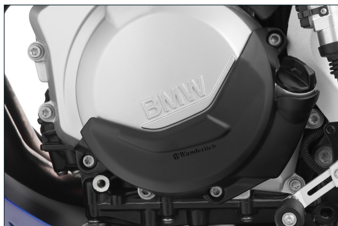
Typisch Wunderlich: Perfekt integriertes Design.