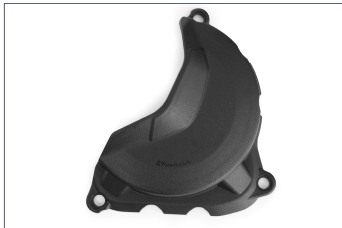
... und rechts für den Kupplungsdeckel.