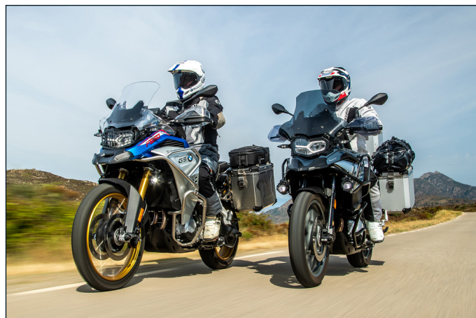
... und passen auch an die F 850 GS Adventure und F 750 GS.