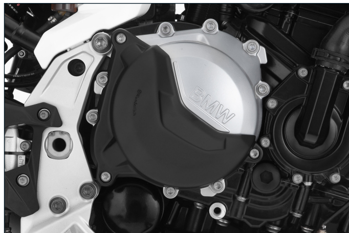
Wunderlich Schutzcover-Set für Kupplungs- und Lichtmaschinendeckel - schwarz (Artikel-Nr.: 26841-002).