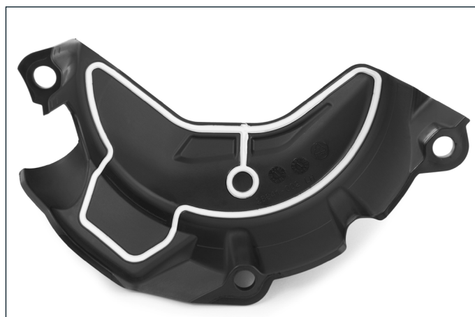
Im inneren schützt ein Elastomer-Formelement aus Silikon die Gehäusedeckel vor Staub und Feuchtigkeit und verhindert so Schmutznester oder gar Korrosion.