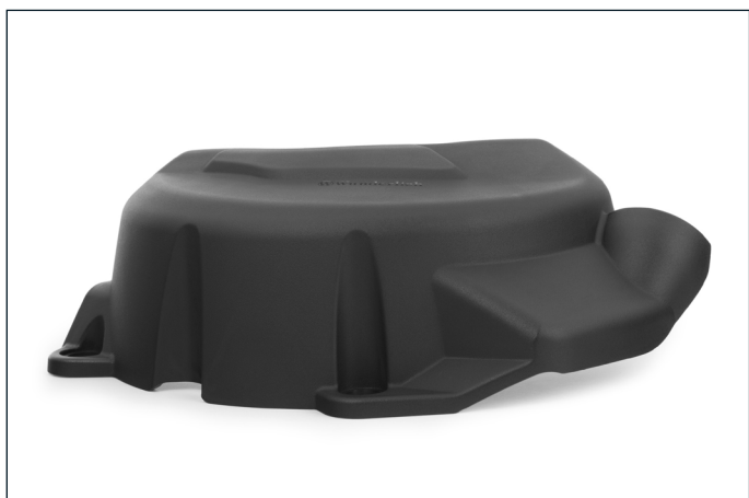
Die Schutzcover umschließen den unteren Bereich der Gehäusedeckel gänzlich und schützen vor Schlägen, Staub und Schmutz.