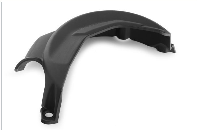
Das Set umfasst zwei Schutzcover, hier links für den Lichtmaschinendeckel ...