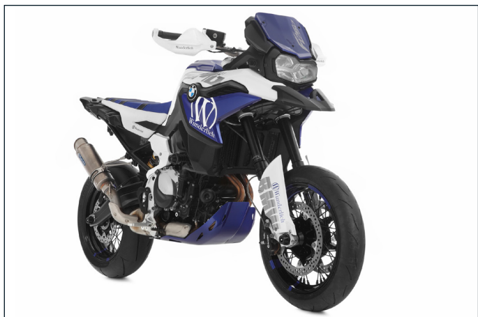
Die Schutzcover wurden im Rahmen unseres F 850 GS »SuMo« Konzepts entwickelt ...