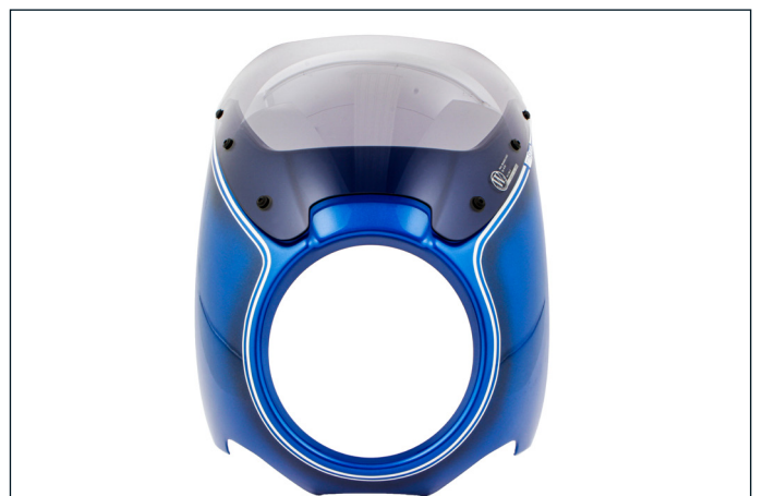
Die Lackierung vertraut Wunderlich dem Lackiermeister an, der auch die Konzept-Motorräder der BMW Zubehörspezialisten lackiert