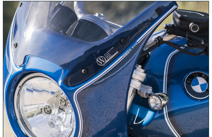
Die Lampenmaske DAYTONA EDITION 35 (Art.-Nr.: 30471-606)

Wer sich also früh entscheidet, erhöht seine Chancen auf seine persönliche Wunschnummer, denn erfahrungsgemäß werden die Nummern 1, 2, 3, 7, 11, 13, 22, 33, 35 die begehrtesten sein. Bei einer so kleinen Serie ist jedoch jede einzelne Limit Nummer exklusiv. Wunderlich fertigt die Lampenmasken in der Reihenfolge des Auftragseingangs und bittet wegen der exklusiven handwerklichen Anfertigung die jeweiligen Kunden, vorsorglich ca. 5-6 Wochen für die Lieferung einzuräumen.