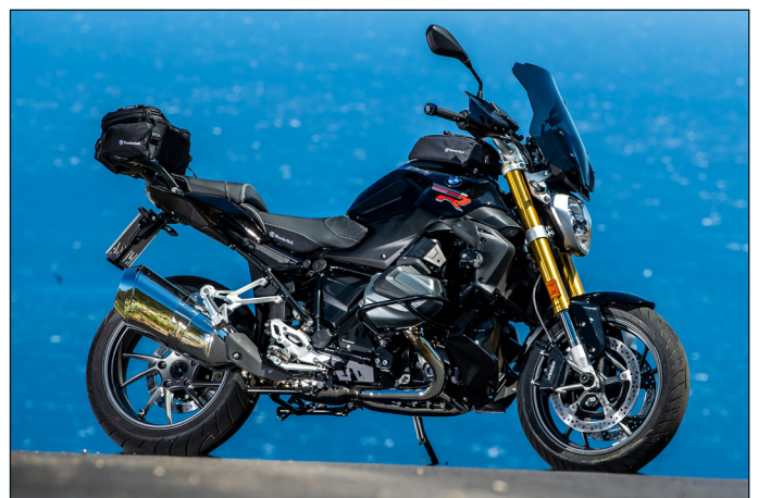
Wunderlich R 1250 R