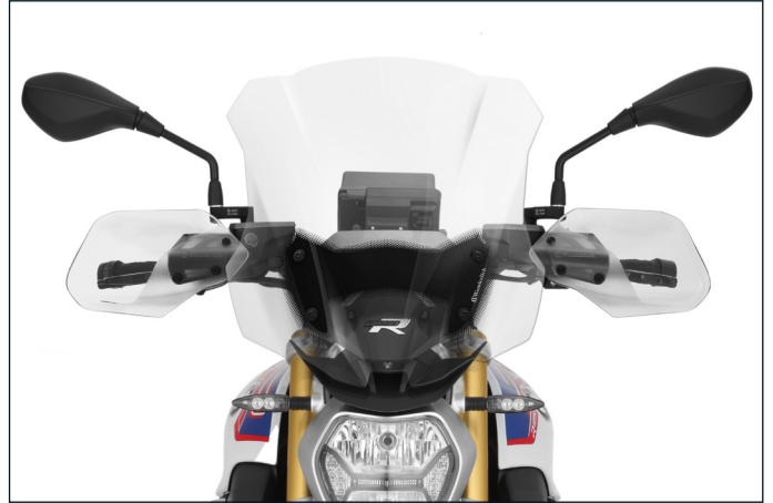
Verkleidungsscheibe »MARATHON« transparent (Art.-Nr.: 30450-235), ergänzt um Handprotektoren (Art.-Nr.: 27520-301)

Der Preis der beiden »MARATHON« Scheibenvarianten (Art.-Nrn.: 30450-235 und -236) beträgt jeweils 189,90 €. Die Verkleidungsscheiben sind Made in Europe und verfügen über eine ABE. Dies muss man genauso wenig erwähnen, wie die großzügige Garantie von 5 Jahren, die Wunderlich auf diese Scheiben gewährt.