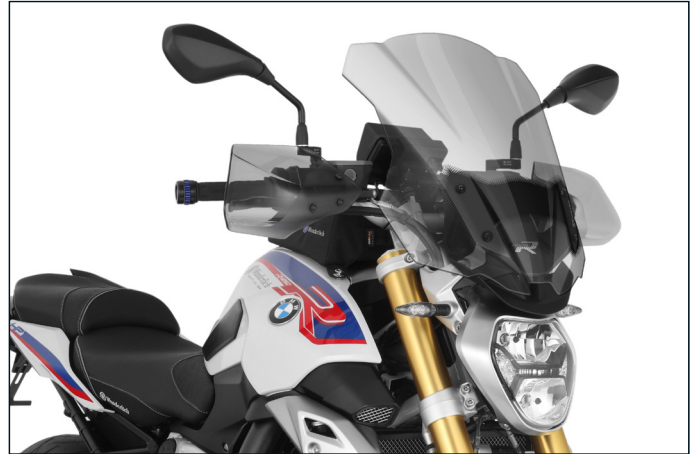
5 mm starker PMMA Acryl-Kunststoff, handpoliert, kein extra Kantenschutz nötig