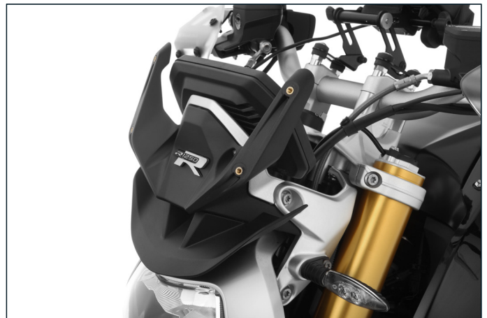
Solide Halterung, formschönes Design integriert sich dezent ins Cockpitdesign (Art.-Nr.: 30450-230)