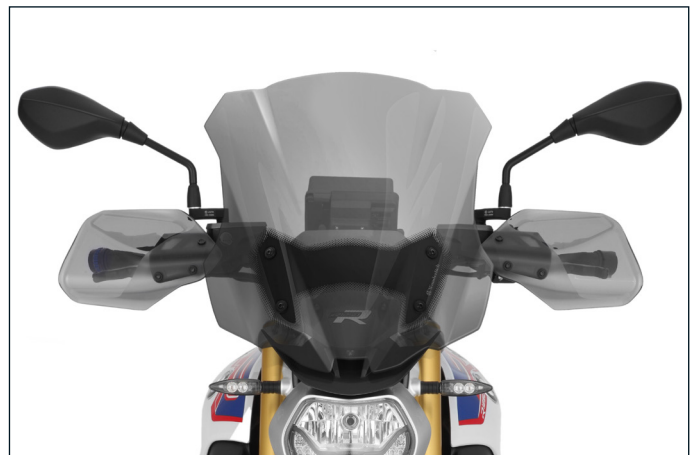
Verkleidungsscheibe »MARATHON« in rauchgrau (Art.-Nr.: 30450-236), ergänzt um Handprotektoren (Art.-Nr.: 27520-302)