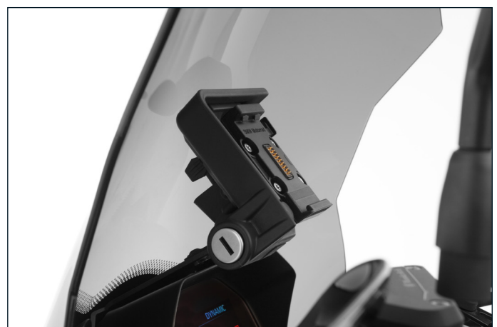
Wunderlichs Navihalterung wird aus Edelstahl gefertigt und in Schwarz pulverbeschichtet