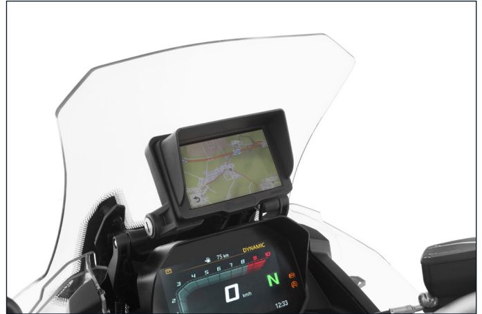
Wunderlich Navihalter für die BMW F 750 und F 850 GS (Art.-Nr.: 21174-002)