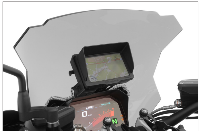
Sicht- und bedienergonomisch optimal in der natürlichen Blickrichtung, hier an einer R 1250 R (Art.-Nr.: 21096-002)