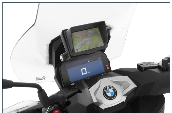
Wunderlich Navihalterung für die BMW Scooter C 400 GT/X (Art.-Nr.: 21095-002 und 21095-202)