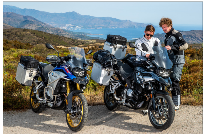
Wunderlich BMW F 750 GS und F 850 GS Adventure