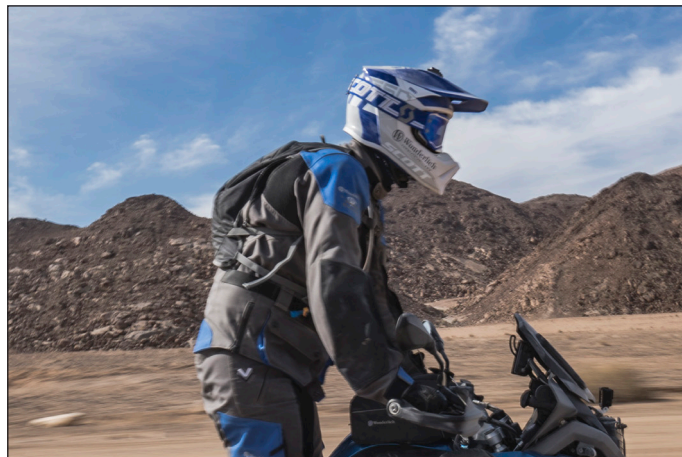
Sportrucksack »MOVE« inkl. Trinksystem (Art.-Nr.: 20862-202) im Einsatz beim WÜSTENTÜMMLER in Namibia