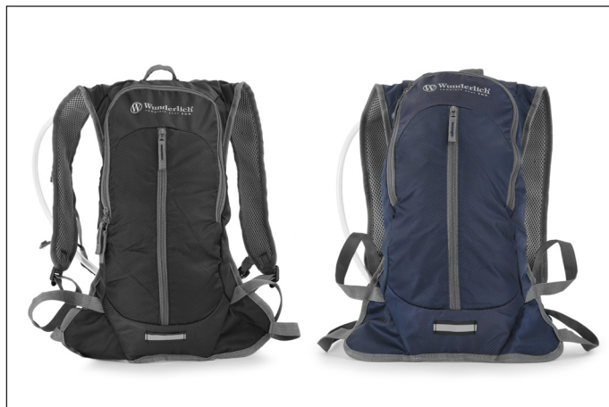
Wunderlich's Sportrucksack »MOVE« ist in den Farben Marineblau und Schwarz erhältlich