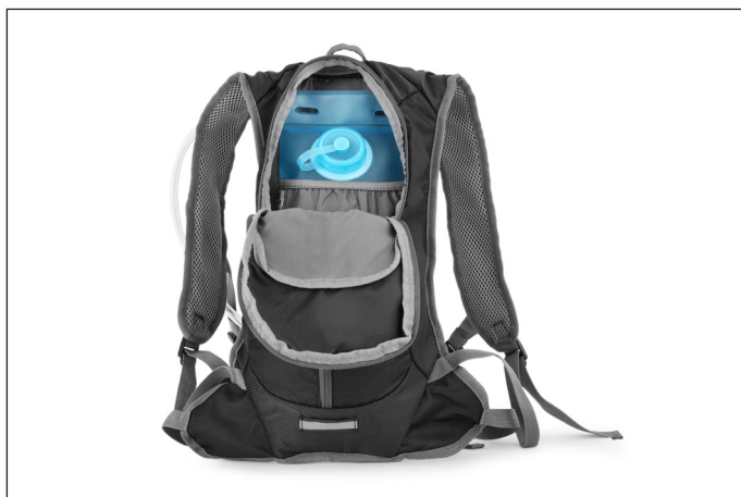
Das komfortable Trinksystem verfügt über ein großzügiges Volumen von zwei Litern nebst 11 Litern Gepäckvolumen...