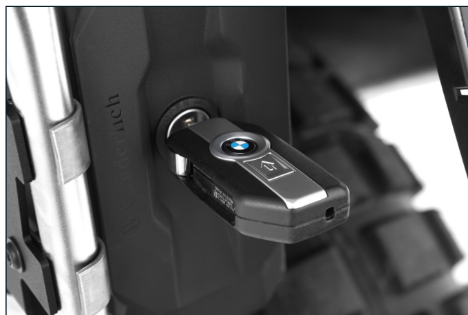
Wahlweise mit Spezialschloss, das auf den BMW-Fahrzeugschlüssel gleichschließend codierbar ist, oder mit einem herkömmlichen Schloss