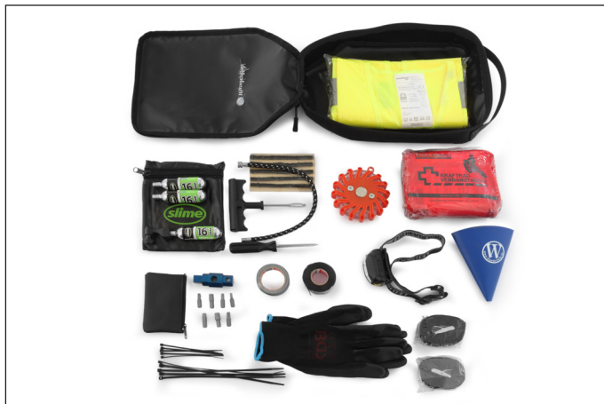
... nach Wunsch zur eigenhändigen Bestückung oder mit einem motorradspezifischen Pannenset ausgestattet