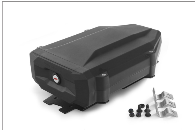
Wunderlichs clevere Werkzeugbox für die BMW R 1250 GS und R 1200 GS LC + Adventure (Art.-Nr.: 41601-100 und 41601-200)

Die Standardvariante ist sofort lieferbar, die codierbare Version ab April 2021.