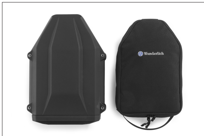
Passend zur Werkzeugbox gibt es von Wunderlich eine praktische, hochwertige Innentasche aus robustem Cordura® 500, ...