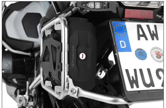
Für die jederzeit gute Zugänglichkeit lässt sie sich vom Heck her -selbstverständlich auch bei montierten Koffern- öffnen und schließen