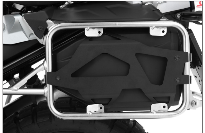
Die Werkzeugbox besteht aus hochwertigem und präzise im Spritzgussverfahren verarbeitetem Kunststoff