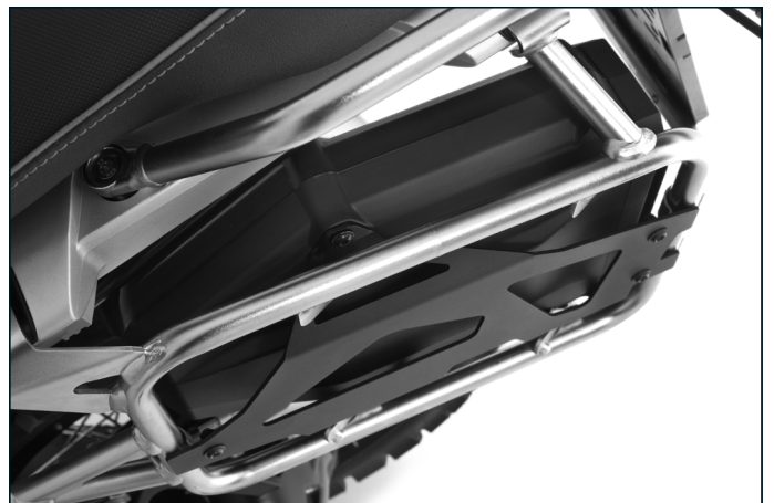
Wasserdicht, leicht und extrem robust: Die Wunderlich Werkzeugbox (Art.-Nr.: 41601-100 und 41601-200)