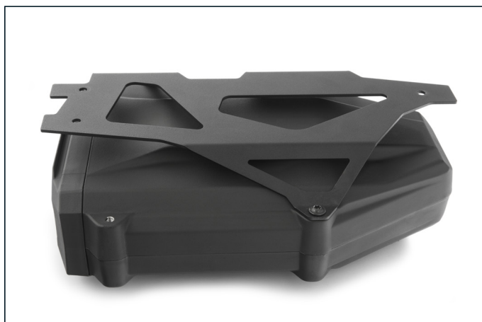
Der Halter besteht aus hochwertigem und präzise verarbeitetem, schwarz pulverbeschichtetem Aluminium