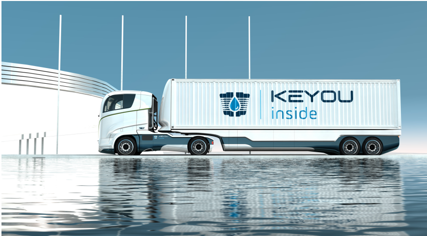
Rendering eines 40-Tonnen-Lkw mit KEYOU-inside Wasserstoffmotor.