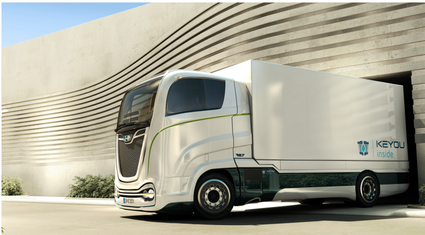
Rendering eines 18-Tonnen-Lkw mit KEYOU-inside Wasserstoffmotor.