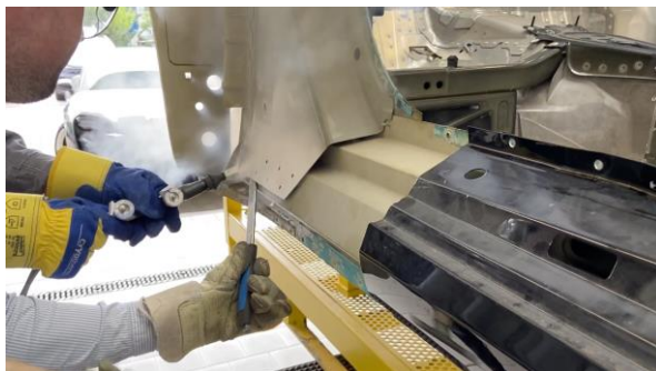
Entfüugung der B-Säule mit SplitMaster