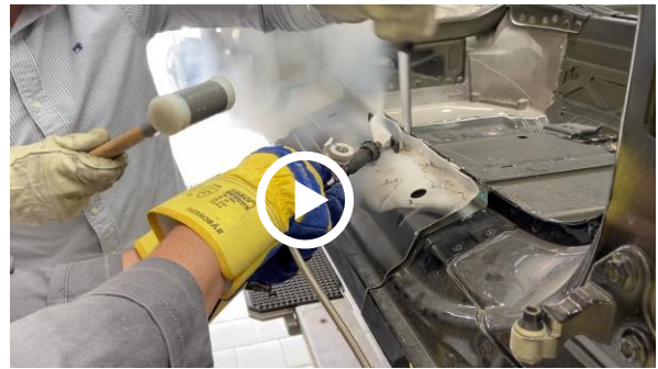
Entfüugung der Außenhaut mit SplitMaster