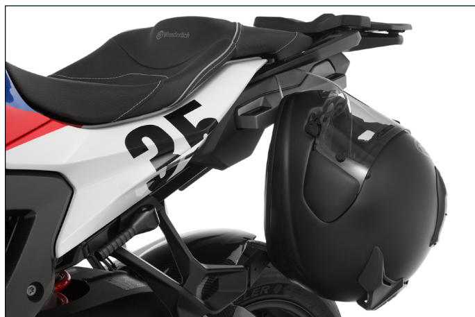
Mit Wunderlich »Helm-Lock« diebstahlsicher an die Leine gelegt: Der Helm