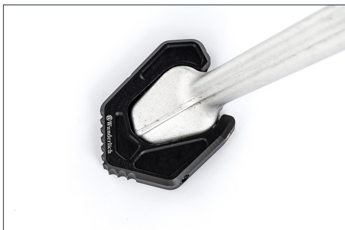
Wunderlich Seitenständerauflagevergrößerung: Kleines Teil mit großer Wirkung