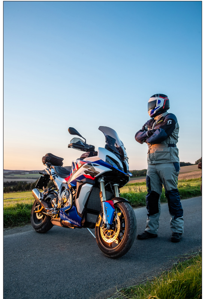
Wunderlich S 1000 XR – perfekt ausgerüstet mit Wunderlich Komponenten