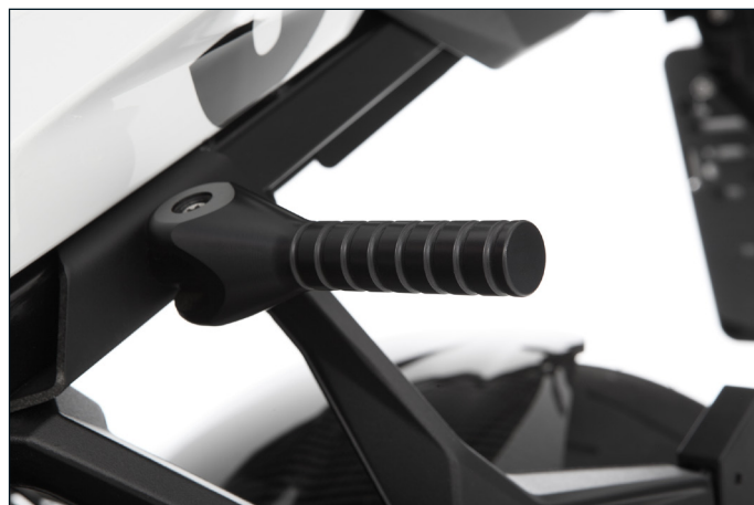
Schöner Heben: Der Aufbockgriff erleichtert das Aufbocken der XR ungemein