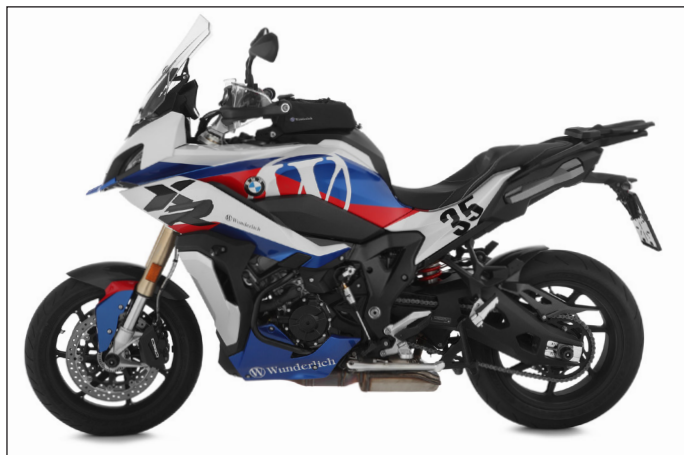
Die Wunderlich S 1000 XR

Kleines Teil. Große Wirkung! 49,90 € inklusive 5 Jahre Garantie! Artikel.-Nr. 36060-602 Seitenständerauflagevergrößerung für die neue BMW S 1000 XR