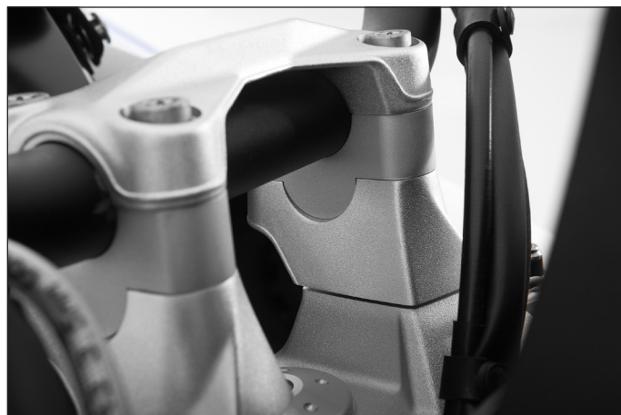
Perfekte Ergonomie für die XR, mehr Komfort, mehr passive Sicherheit und bessere Übersicht im Verkehr – Wunderlichs Lenkererhöhung »ERGO«

Artikel.-Nr. 35753-001/-002 Wunderlich Verkleidungsscheibe »MARATHON« (transparent/rauchgrau getönt)