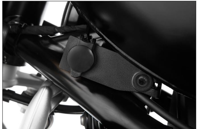
Wunderlich Bordsteckdose (mit Schutzabdeckung) nach DIN ISO 4165 für die BMW R nineT (Euro 5), die serienmäßig nur noch über einen USB-Anschluss verfügen