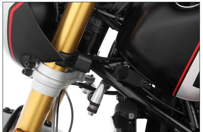
Durchdacht platziert: Vorne links, unterhalb des Tanks, in perfekter Reichweite für Verbraucher im Bereich des Cockpits oder solche, die im Tankrucksack mitgeführt werden