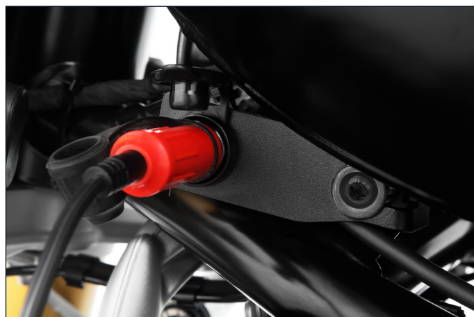
... zum bequemen Laden der Motorradbatterie mit Can-Bus-fähigen Ladegeräten