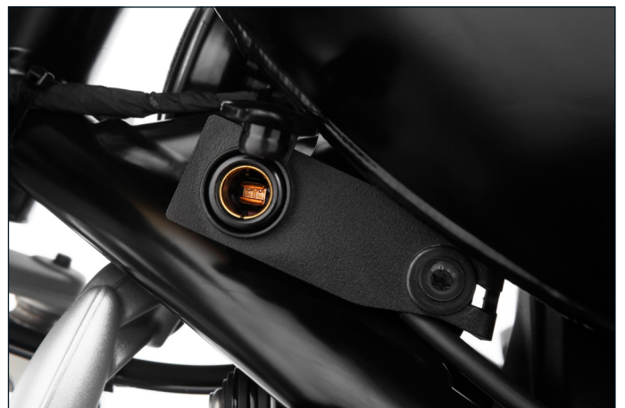
Für alle Verbraucher...