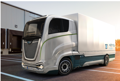
18t-LKW mit H2-Motor und KEYOU-inside (Modell, erster 18t LKW kommt in Q1 2022)