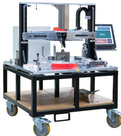
Bild Nr. 15-02 WP-Protech-Messplatz.jpg

Die Smart Testing Solution (STS) fungiert wie eine messende Lehre. Sie vermisst definierte Punkte und Merkmale über die gesamte Laufzeit eines Bauteils.