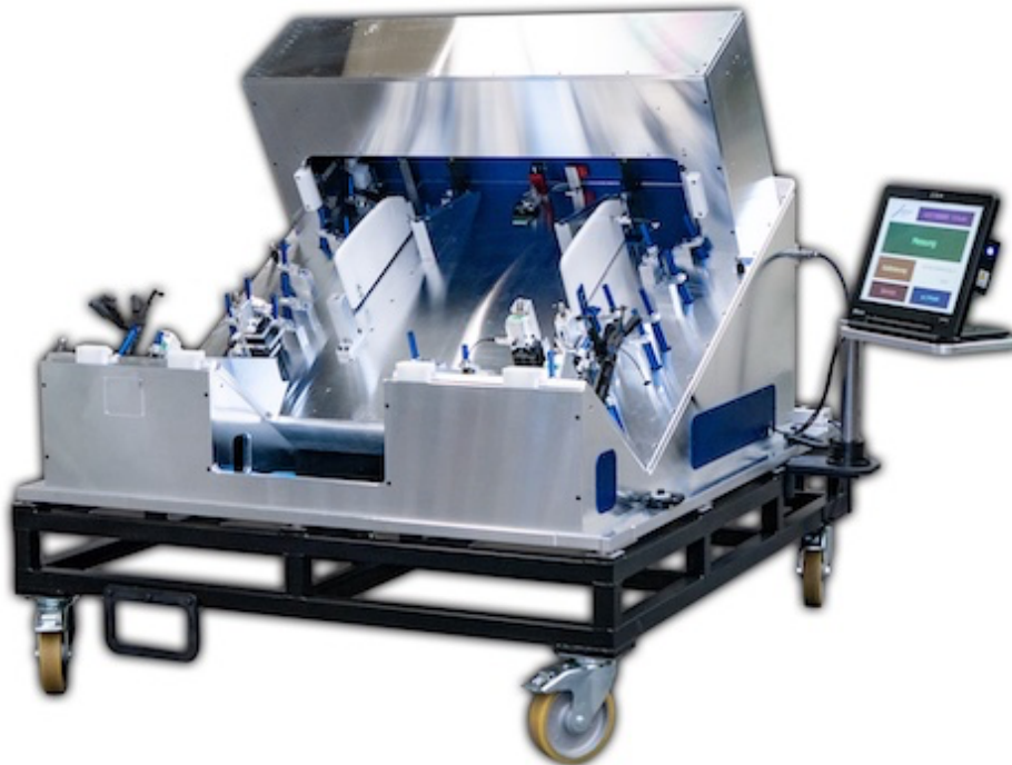
Bild Nr. 15-04 WP-Protech-MessendeLehre.jpg

Für einen Prüfauftrag der ganz besonderen Art hat Protech eine messende Lehre für das Targadach des Porsche 911 entwickelt und gebaut.